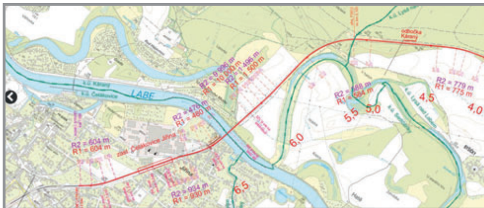
Úsek železniční trati z Čelákovice do Lysé nad Labem, který projde v následujících letech optimalizací. Předpokládané náklady stavby činí 1,28 miliardy korun bez DPH.