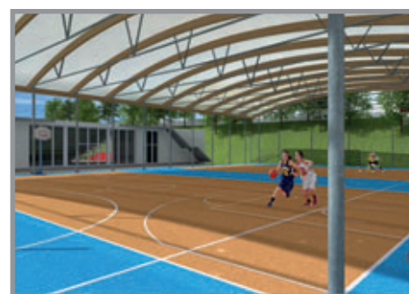
Městský stadion.