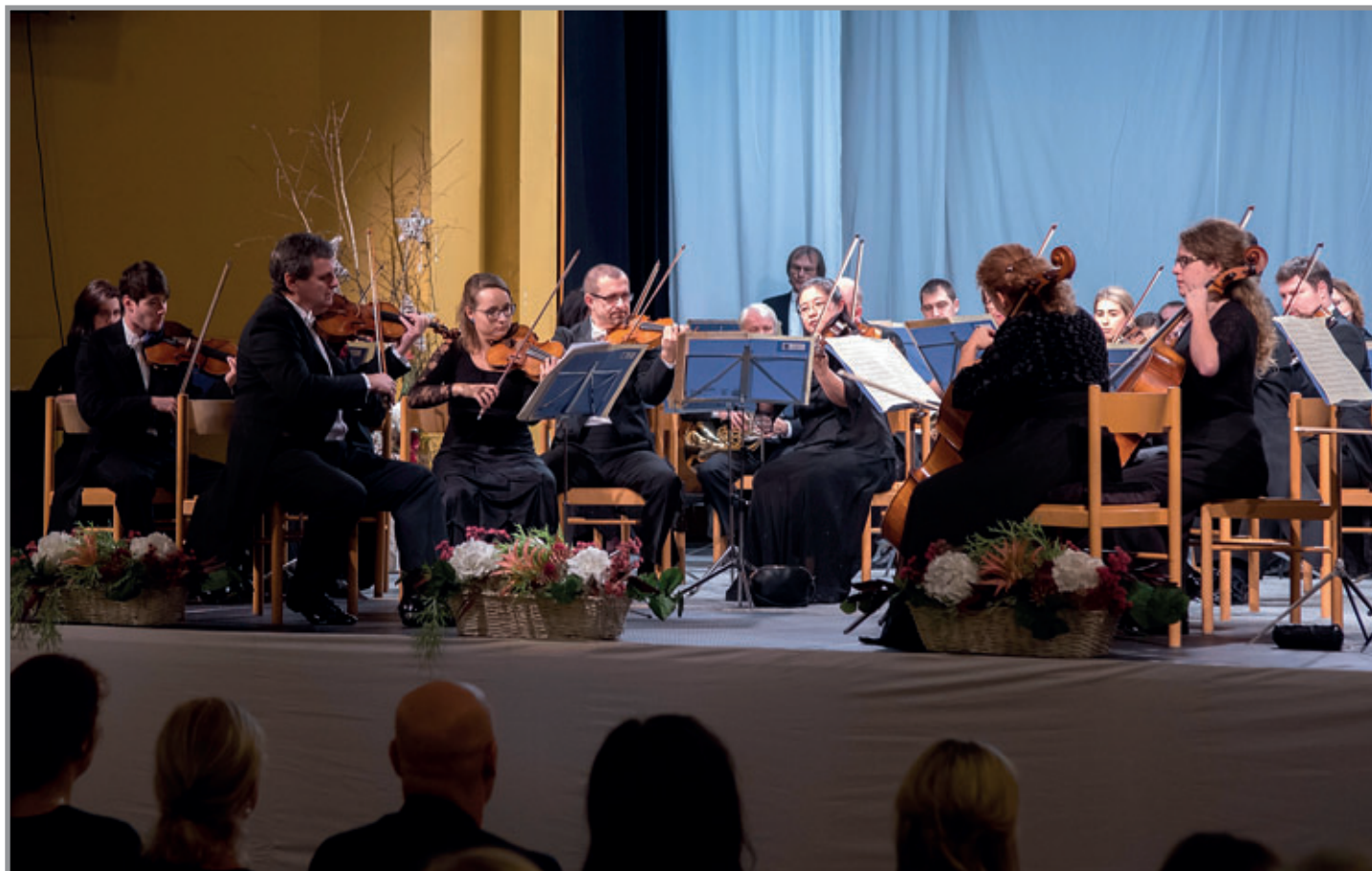
V úterý 15. ledna vystoupil v čelákovickém Kulturním domě na Novoročním koncertu města Čelákovice Pražský komorní orchestr.