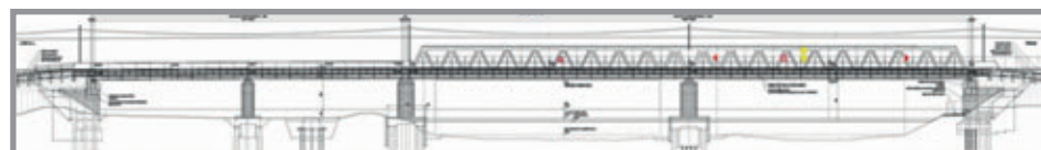
Navržený nový železniční most přes řeku Labe v Čelákovici. Pole č. 1 a 2 bude přemostěno spojitou ocelovou nosnou konstrukcí s plnostěnnými nosníky a ortotropní mostovkou. Pole č. 3 a 4 bude přemostěno spojitou ocelovou příhradovou nosnou konstrukcí s ortotropní mostovkou. Opěry mostu budou sanovány, pilíře budou nové. Založení konstrukce bude zajištěno pomocí kombinace mikropilot a tryskové injektáže.